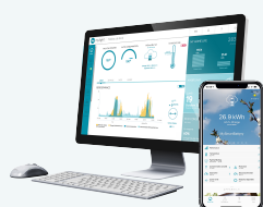
Suite logiciel MyLight Systems