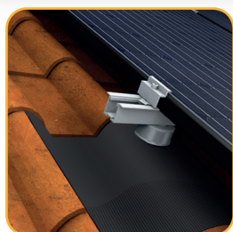
Tuile canal fortement galbée