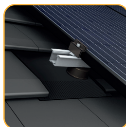
Tuile mécanique à faible galbe